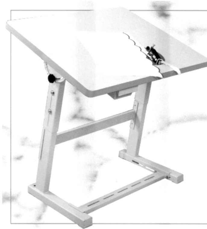
Fig. 1 La tagliasmerlo rappresentata in figura è comprensiva del sostegno regolabile

La PR85 è una macchina creata per il taglio dello smerlo, questa operazione è resa sicura in quanto la lama circolare è protetta da 2 sonde.